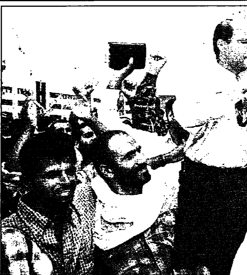
مواطنون من بئر السبع يعرضون الناب العربي طلب الصانع تعيينا عن تأييدهم له

واضاف النائب كوهين الذي كان يقف بذلك على ثلاثة حوادث متصلة وقعت في جنوب لبنان خلال الايام المناسين (خلال عطلة عيد رأس السنة الحبرية الجديدة) اسفرت حسب بيانات المتحدث العسكري الاسرائيلي عن مقتل جنديين وجرح اثنين آخرين من اعضاء لجنة الخارجية والأمن البرلمانية سيصرون إجراء تحقيقات اسرائيلية تحقيقا جنديا جادا في ما حدث أثناء اللقاء اليهودي من لفة أو توبوه وتسل على الانتعاش التي ستحصل لها هذه التحقيقات، وتابع أنه سيلعب هذا التسبوع اثناء مشؤل وزير الدفاع الاسرائيلي اسحق موردياي امام جلسة مقرورة للجنة الخارجية والأمن للحصول على تقرير بكل التفاصيل المتعلقة بالمسألة التي تحققت في الجيش وما ستحصل اليه لجان التحقيق العسكرية المكلفة بقصي الحوادث، واتهم رئيس اللجنة البرلمانية واعضاء اللجنة فيها عن توجيه اتهامات واتهامات عنلية مقلقة للجيش الاسرائيلي في هذا الخصوص، وقالوا أنهم يفضلون عدم التعلق على تلك تقارير مغلطة بشأن الحوادث الأخيرة في جنوب لبنان والتي اسبغت في أثاره الجسد مسجدا في